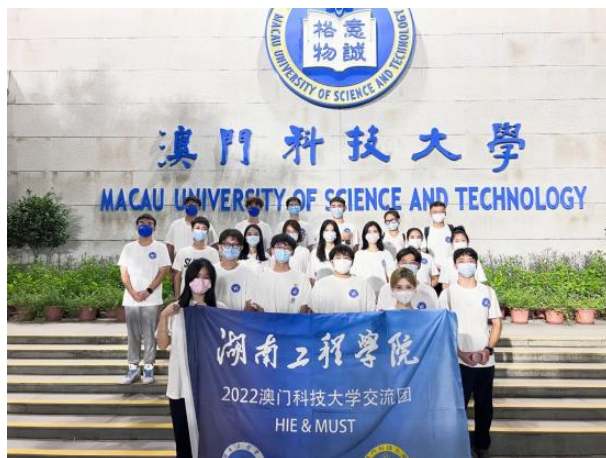
湖南工程学院赴澳科大交流生合影