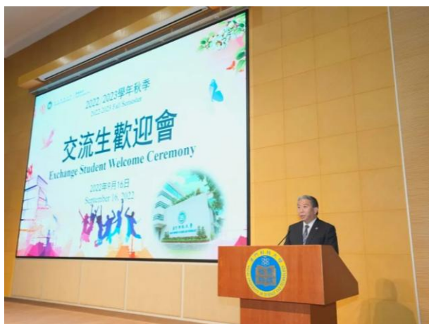
澳科大 2022 秋季学期交流生欢迎会