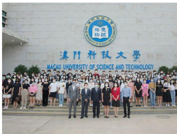
澳科大 2022 秋季学期交流生合影