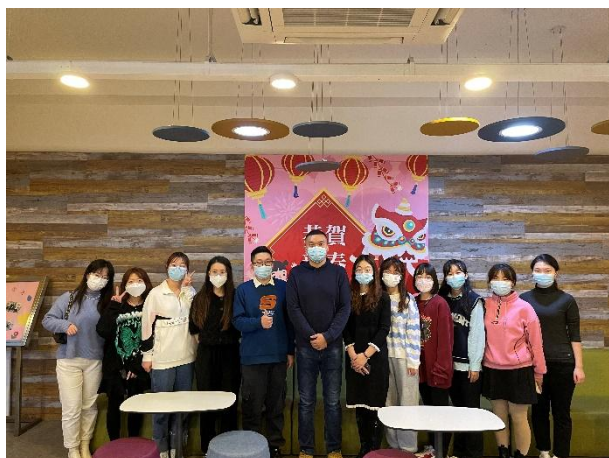
宁夏医科大学赴澳科大交流生心得分享会